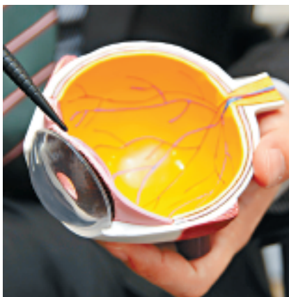
▼近年研發的人工晶體為淡黃色，有單焦距、多焦距、散光焦距三種。